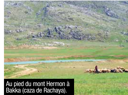
Au pied du mont Hermon à Bakka (caza de Rachaya).

De nombreuses activités écolos sont prévues dans le domaine géré par arcenciel. Cette association a aussi aménagé une auberge jeunesse à Taanayel, l'écologie et l'auberge St Michel dans le Chouf.