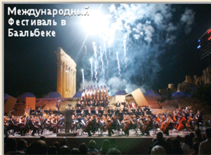
Международный фестиваль в Баальбеке