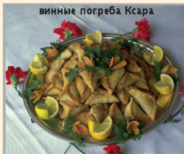
винные поgreба Ксара