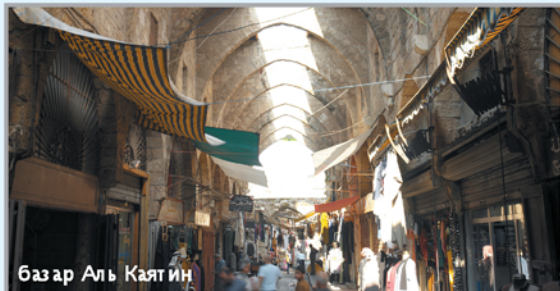
Базар Аль Каят Ин

Тоположенный в 85 километру север от Айруту город разделит древнюю и трудную историю побережья. Это ему его шумный и пестрый восточный колорит, то здесь то там соседствует с пятнадцатого прошлого. Чистой по величине город Бивью. Но богат в истории он не уступает Айруту. Именно здесь много исторических пятничков времён мюлюкских и османских султанов, средневековые рынки и узенькие улочки сохранили почти без изменения. И этот город изменит своими восточными бусами, которые сохраняют свою неповторимую прелесть в течении пяти веков. Здесь можно найти все, что душе угодно – ткани и золотые украшения, восточные пряности и национальные костюмы, медные и бронзовые изделия, странные ковры, неповторимые продукты, специи, парфюмов и знаменитое кремное мыло.